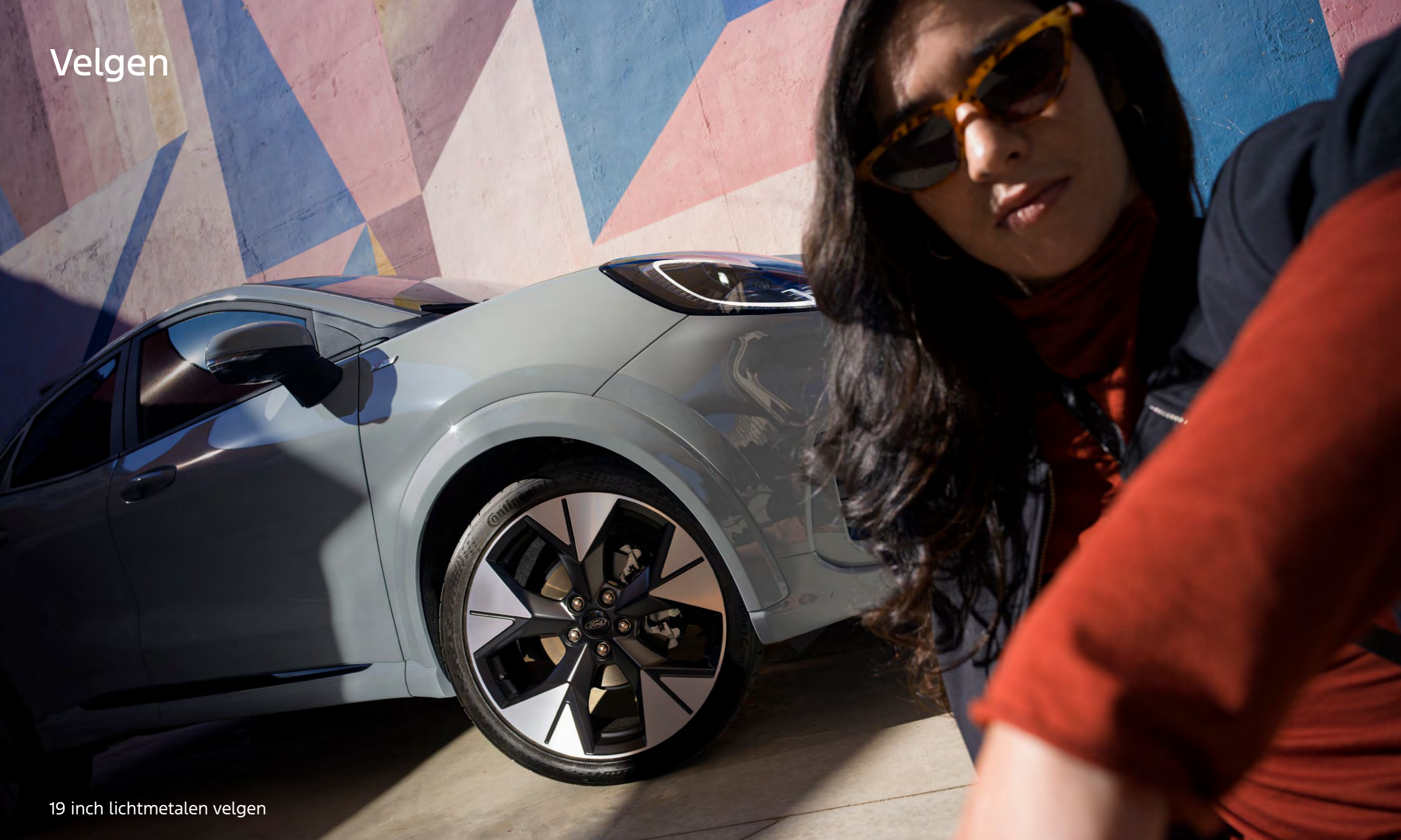
19 inch lichtmetalen velgen