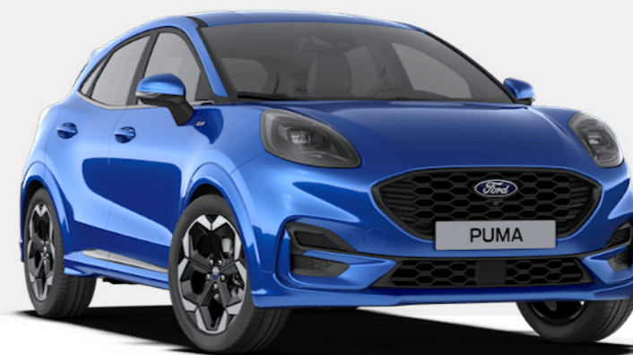
Desert Island Blue